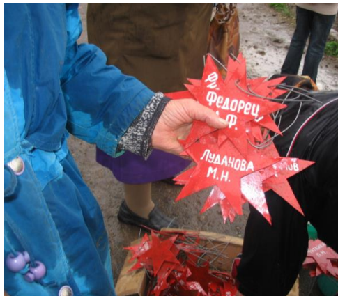
Именные звезды на именные деревья