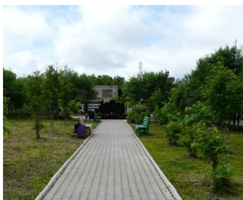
Аллея Памяти ветеранов в 2015 г.