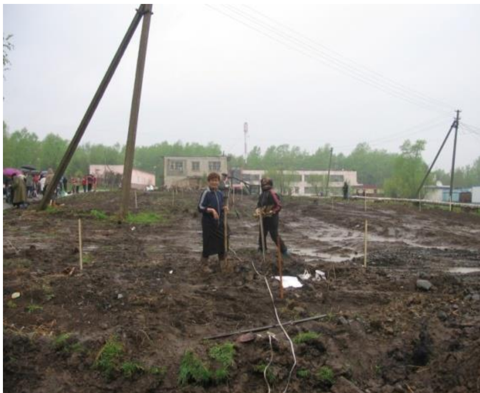
Начало закладки Аллеи Памяти ветеранов. 19 мая 2005 года

Началась высадка кустов рябины и калины родственниками: дети погибших, внуки прикрепляли пятиконечные звёзды, целовали их, плакали, молились.