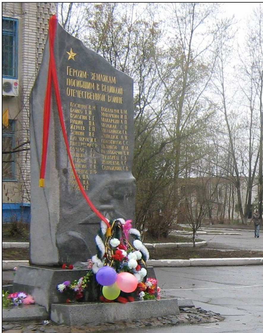
Обелиск «Героям-землякам, погибшим в Великой Отечественной войне». 1997 г.

центр, школа. Такое местоположение позволяет каждый день большинству сельчан проходить мимо памятника и волей или неволей обязательно вспомнить людей, которые защищали нашу страну от врагов. И, может быть, участника войны, благодаря которому в селе появился этот обелиск.