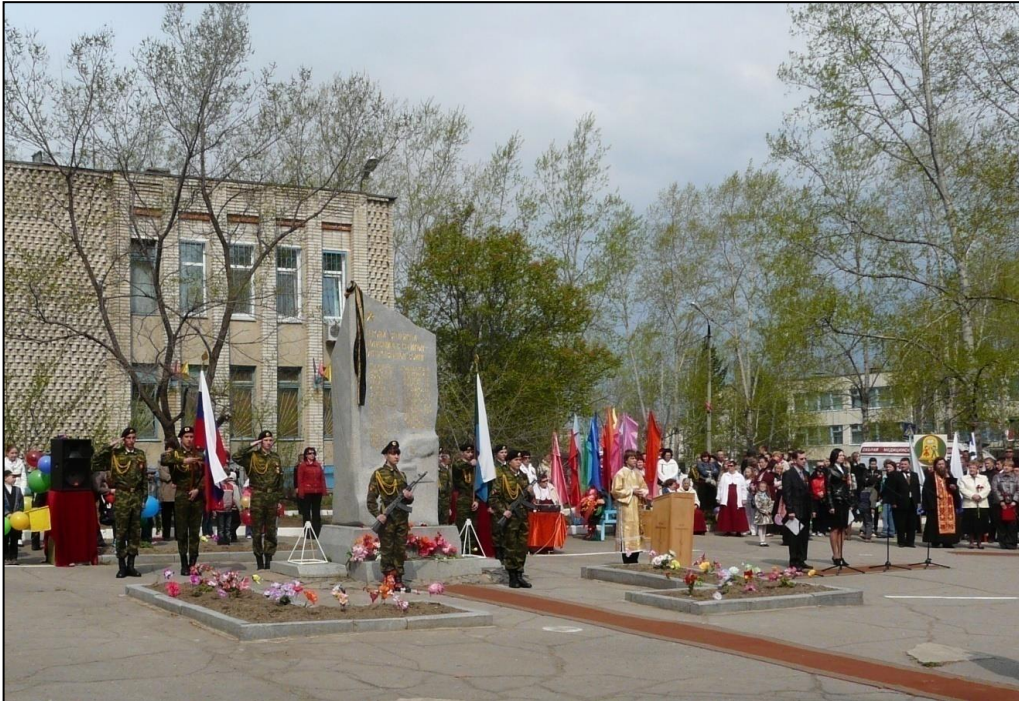
Сегодня все сельские праздники, митинги проводятся у обелиска. Участие воспитанников ВПО «Звезда» и церемониального отряда «Патриот» в сельских праздниках