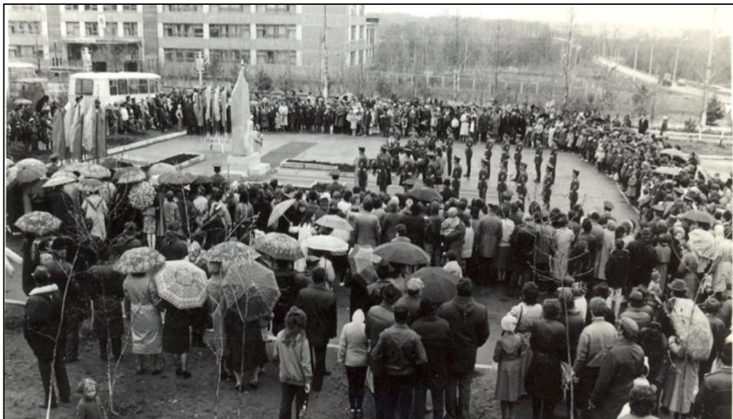
Открытие сельского обелиска в 1989 году.